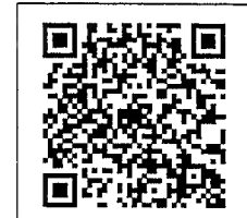
QR-Code เพื่อสอบถาม