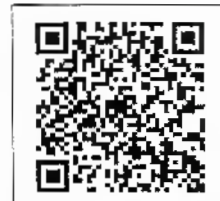
QR-Code เพื่อสอบถาม