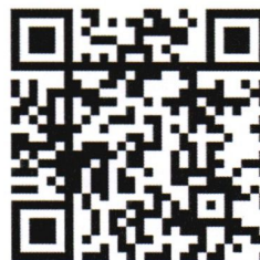
HPV Clip EP.01