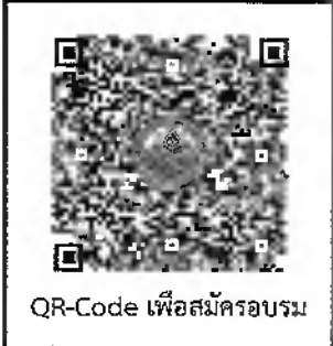
QR-Code เพื่อสมัครอบรม

ค่าลงทะเบียน คนละ ๓,๙๐๐ บาท (สามพันเก้าร้อยบาทถ้วน) การชำระเงิน ชำระเงินสดในวันลงทะเบียน ชำระเงินโดยวิธีการโอนเงินเข้าบัญชีออมทรัพย์ ธนาคาร : ธนาคารกรุงไทย สาขามหาวิทยาลัยธรรมศาสตร์ ท่าพระจันทร์ ชื่อบัญชี : มหาวิทยาลัยศิลปากร เลขที่บัญชี : ๙๘๒-๓-๐๔๗๘๑-๒