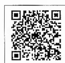
QR-Code เพื่อสอบถาม