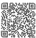
ลงทะเบียน