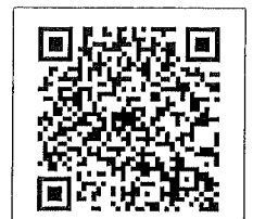
QR-Code เพื่อสอบถามข้อมูล