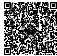
QR-Code เพื่อสมัครอบรม

ชำระเงินโดยวิธีการโอนเงินเข้าบัญชีออมทรัพย์