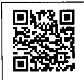
Facebook ประชาสัมพันธ์หลักสูตร