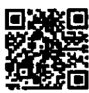
ระดับนานาชาติ