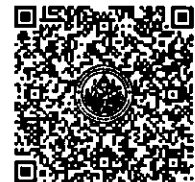
QR-Code เพื่อสมัครอบรม

ชำระเงินโดยวิธีการโอนเงินเข้าบัญชีออมทรัพย์