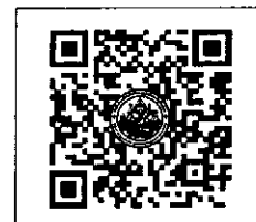
QR-Code เว็บไซต์

ผู้อำนวยการสำนักงานบริการวิชาการ มหาวิทยาลัยศิลปากร