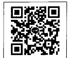
QR-Code เพื่อสอบถามข้อมูล

สำนักงานบริการวิชาการ มหาวิทยาลัยศิลปากร (ตลิ่งชัน)