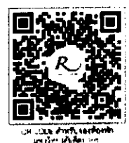
QR-Code สำหรับจองห้องพัก

โรงแรมรอยัลริเวอร์ ๒๑๙ ซอยเจริญสุขนิทวงศ์ ๖๖/๑ แขวงบางพลัด เขตบางพลัด กรุงเทพฯ ๑๐๗๐๐ โทรศัพท์: ๐๒-๔๒๒-๙๒๒๒ โทรสาร : ๐๒-๔๓๓-๕๘๘๐ E-mail : rsvn@royalriverhotel.com