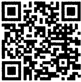
ประเภททั่วไป