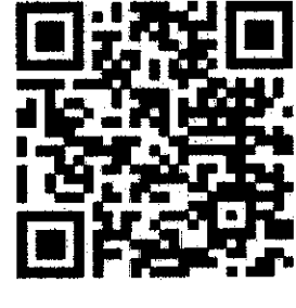
ประเภทอำนวยการ