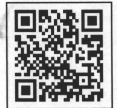
สแกน QRcode เพื่อลงทะเบียน Online

กรุณาตอบมาที่ E-mail : kanokwanpha@pim.ac.th , jarinpornrac@pim.ac.th