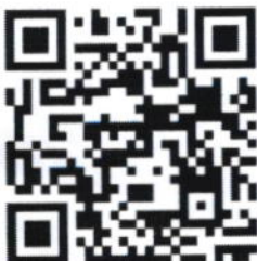
QR code ไฟล์โปสเตอร์ประชาสัมพันธ์