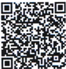
QR code ลงทะเบียน

จึงเรียนมาเพื่อโปรดพิจารณาให้ความอนุเคราะห์ และขอขอบพระคุณเป็นอย่างสูงมา ณ โอกาสนี้