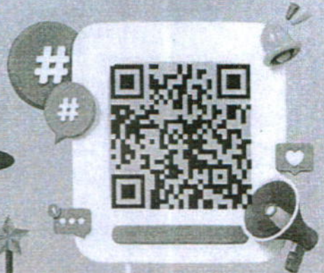
ลงทะเบียนเข้าร่วมประชุมฯ